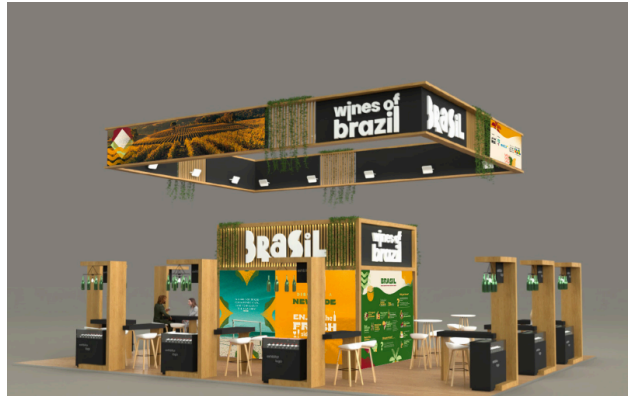
(1) Artwork of the Wines of Brazil stand at ProWein 2024