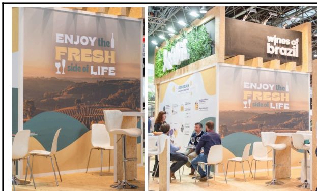
E também artes do nosso stand na feira ProWein 2024: