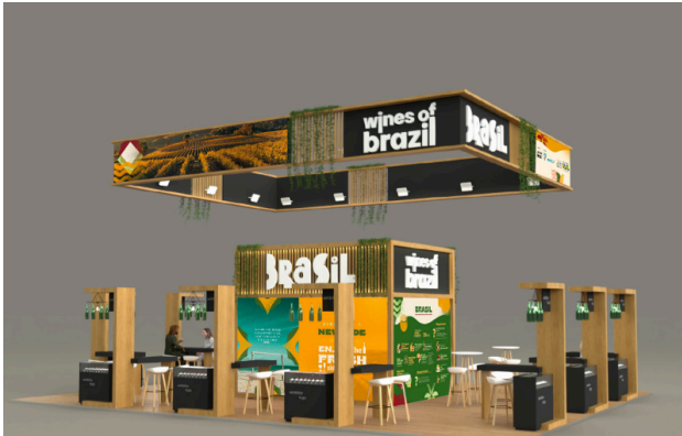
(1) Arte do stand do Wines of Brazil na ProWein 2024