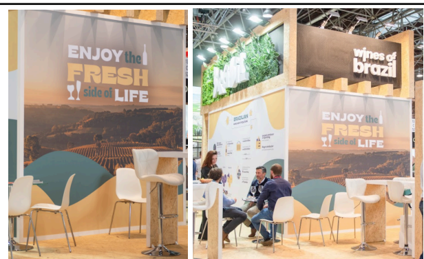
Art concept of our stand at ProWein 2024.

Considerar também uma equipe de limpeza após a finalização do stand para que o mesmo esteja limpo para o início da feira.