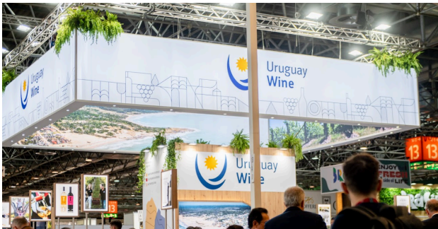
(2) Outros exemplos: